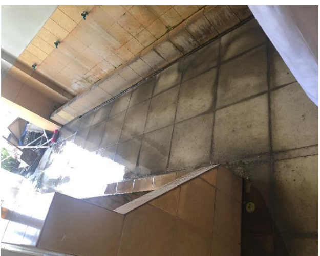
Lantai tempat wudhlu